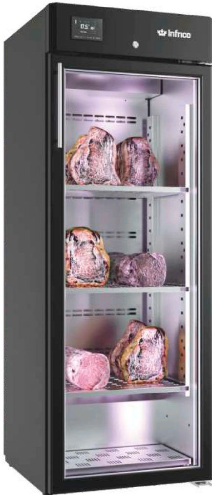
AC 280 MDAB